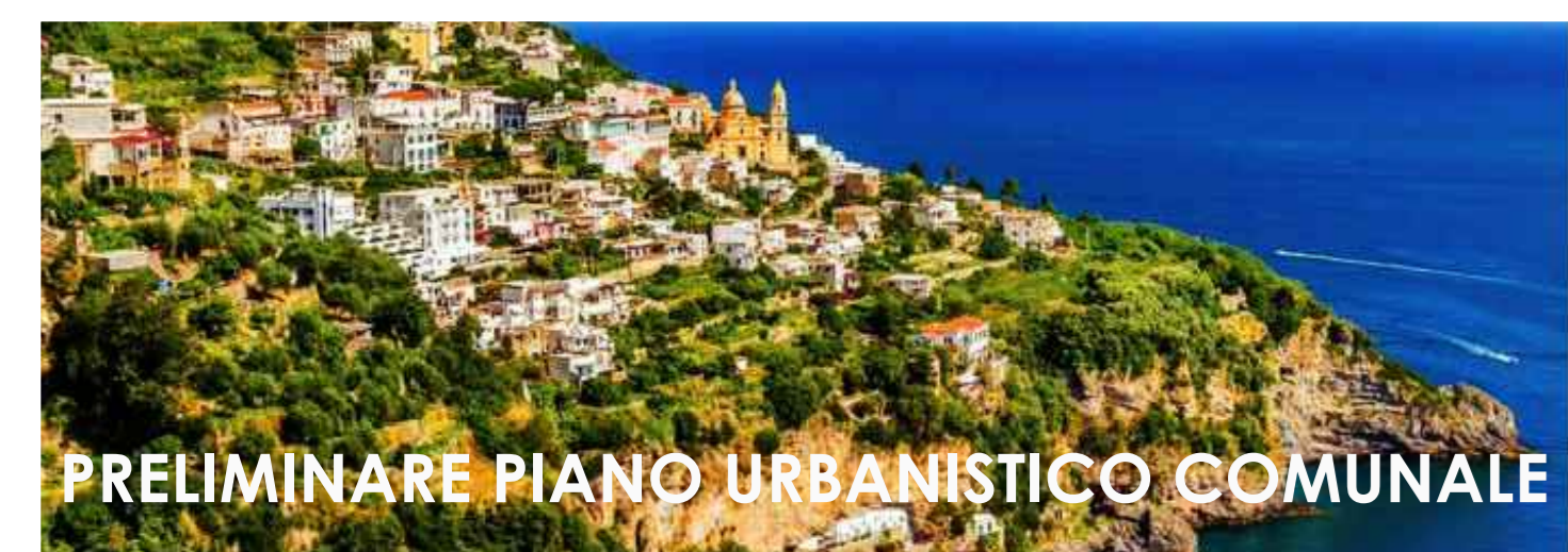
PRELIMINARE PIANO URBANISTICO COMUNALE